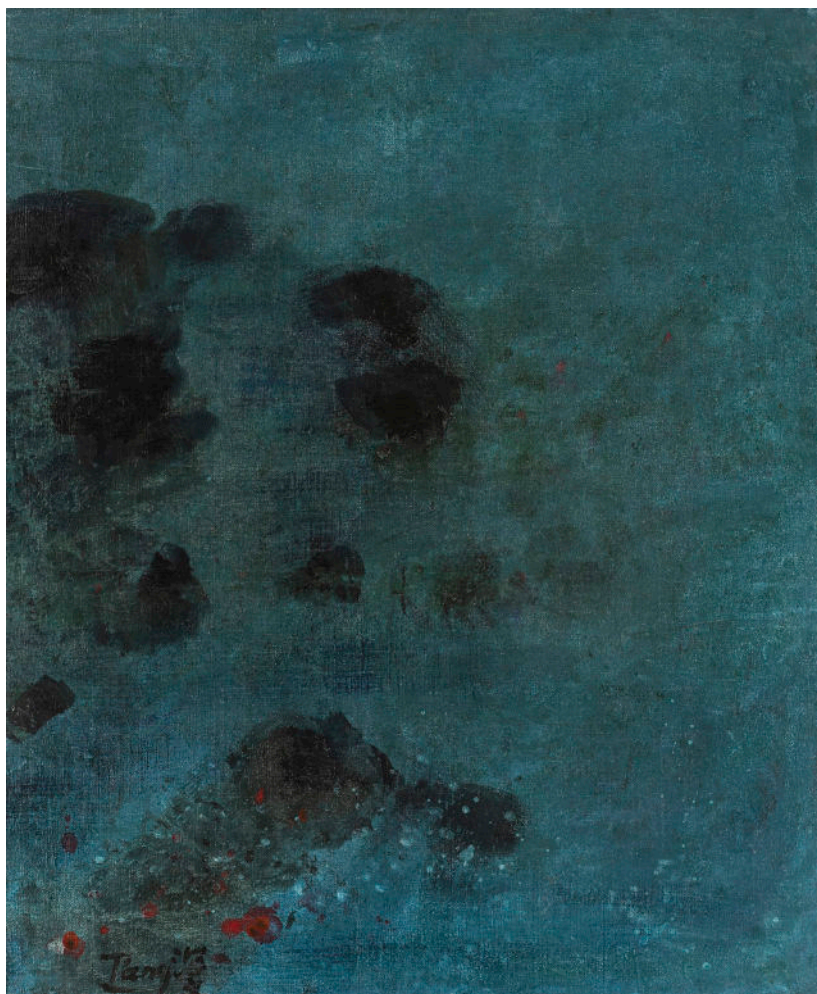
Sans Titre , 1965-70, Huile sur toile, 76 x 61 cm

Un autre aspect manifeste de la peinture de T'ang est son absence de toute servilité . Quelles que soient ses sources d'influences ou ses références, ses œuvres et son style sont immédiatement distinguables et identifiables . Il s'agit d'une personnalité « remarquable » dans les deux sens du terme, propre et littéral : il est libre.