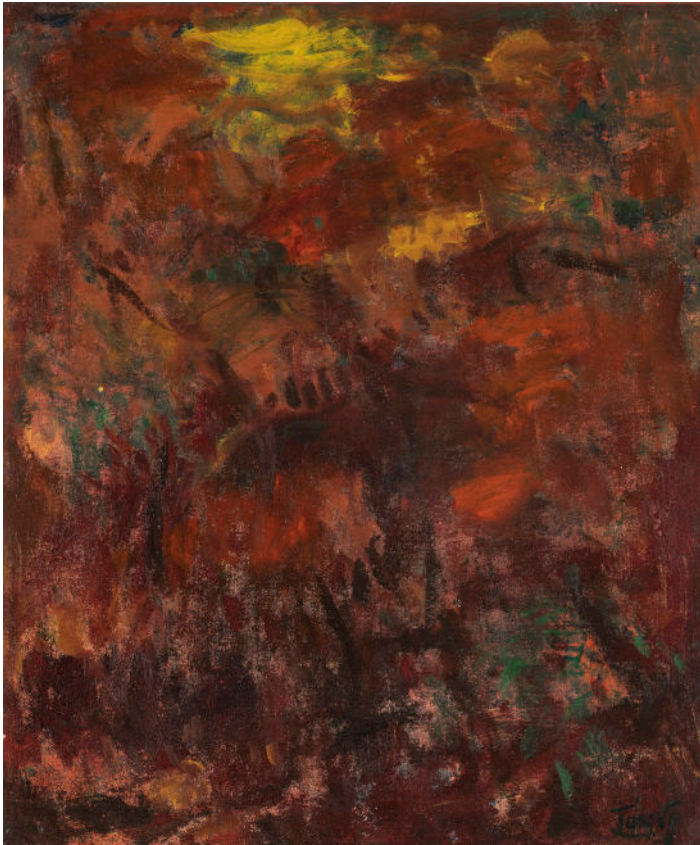
Dernier Rayon / Last Ray, Huile sur toile, 53,5 x 46 cm.

gestuel d'un Degottex, aux côtés duquel il fut exposé, d'un Marfaing, voire d'un Soulages.