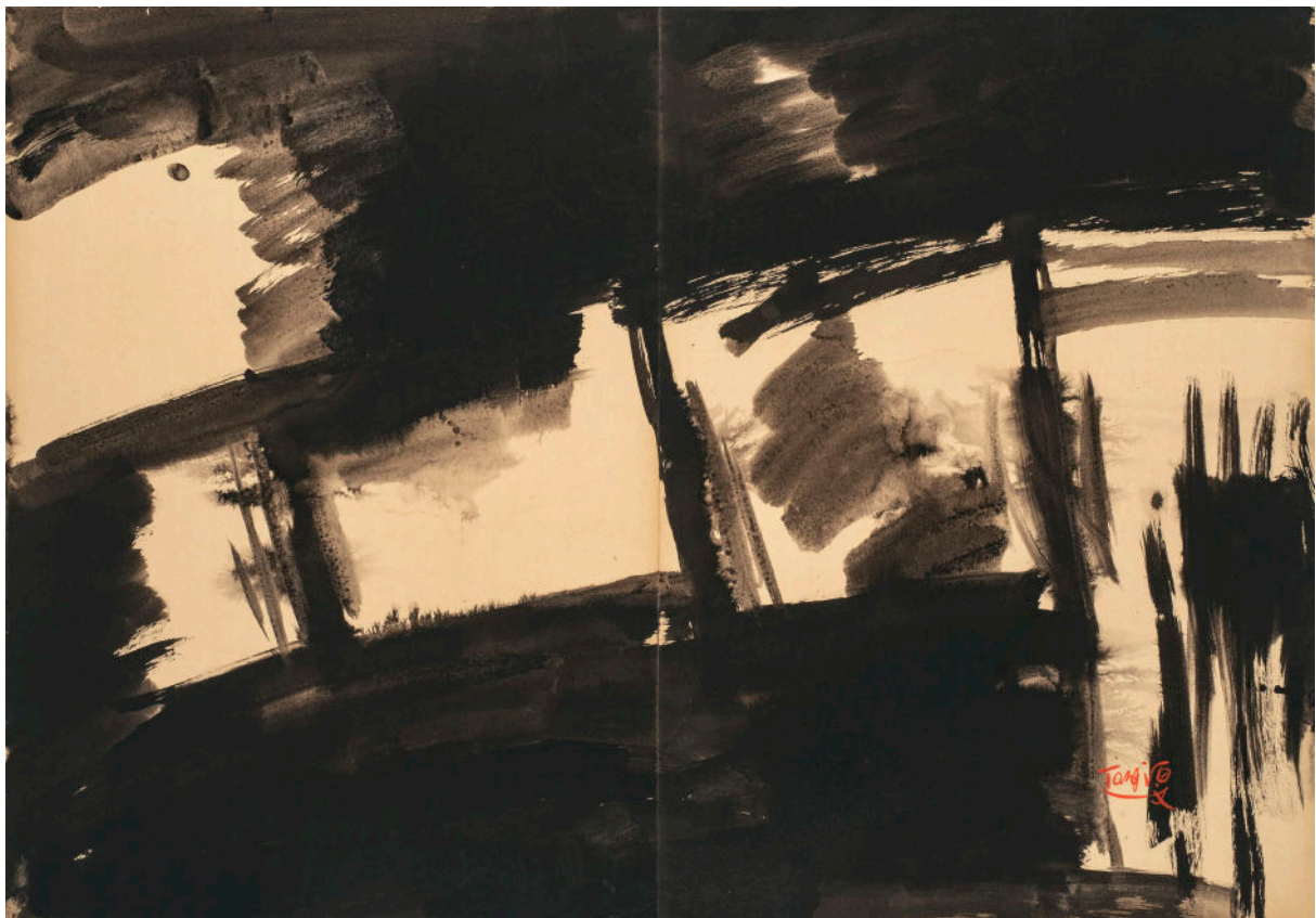
Sans Titre, diptyque, Encre sur carton Kyro, 70 x 100 cm.

Rien ne s'oppose à placer T'ang au milieu d'un « nuage » de formes et de gestes, qui inclurait le paysagisme abstrait d'un Debré ou d'un Lopicque, d'un Tal-Coat, ou l'art tout