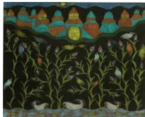
Karl Beudelere, Entité marron , Stylo bille sur papier, 21 x 29,7 cm